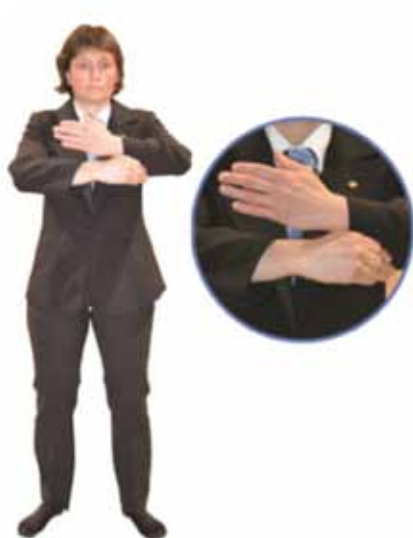
Pénalité pour prise "pistolet"