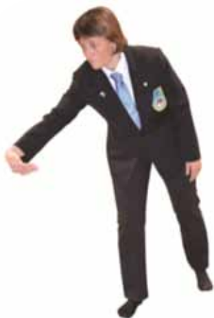
Pénalité pour saisie de jambe