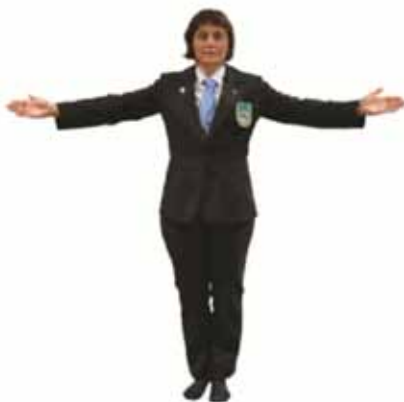
Inviter les combattants à entrer sur le tatami