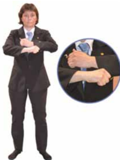
Pénalité pour doigts à l'intérieur de la manche