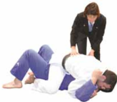
Sono-Mama \Leftrightarrow Yoshi