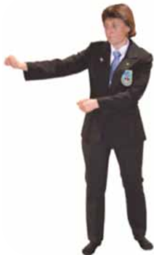
Pénalité pour attitude défensive