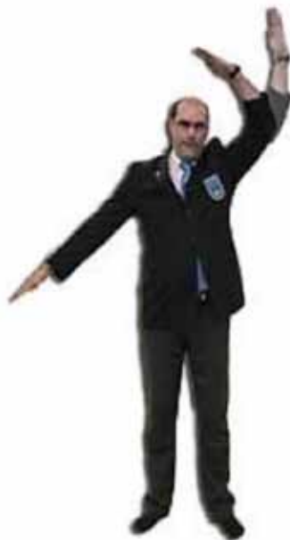
Pour annuler une opinion exprimée