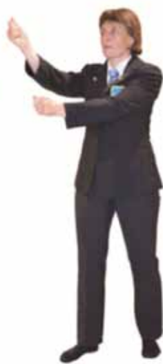
Pénalité pour garde croisée