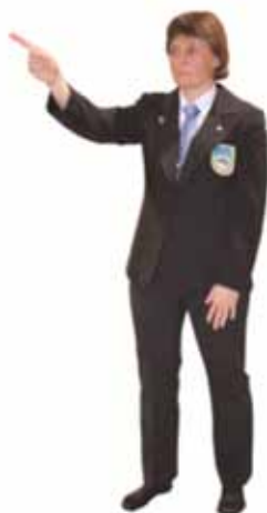
Attribuer une pénalité