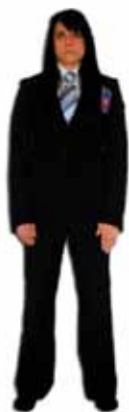
Position avant le combat