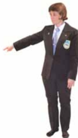
Pénalité pour sortie de tapis