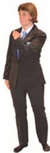
Pénalité pour refus de Kumi Kata (protection du revers)